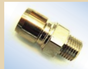
Raccordo maschio per Standard/Flex Inflator e Quick Inflator (adattabile a tutti i modelli di Inflator), no. art. .... 096069