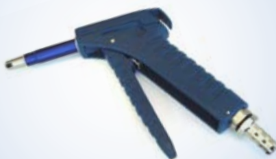
Bates Standard Inflator, no. art. 096072

Ugelli ed altri accessori possono essere ordinati separatamente (vedi retro pagina).