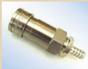
Giunto ad innesto rapido da 3/8" con valvola per Quick Inflator, no. art. .... 096030