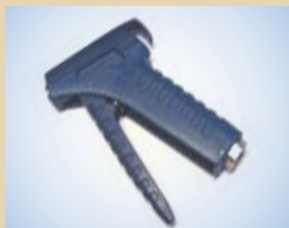
Impugnatura per Inflator, no. art. .... 096060