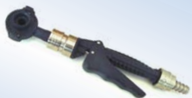
Bates Quick Inflator, no. art. 096078

La boccola di innesto alla valvola ed altri accessori possono essere ordinati separatamente (vedi retro pagina).