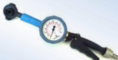
Bates Quick Inflator allungato con manometro Ø40 mm, no. art. 096075