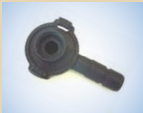
Boccola ad innesto rapido per Quick Inflator, no. art. .... 096054