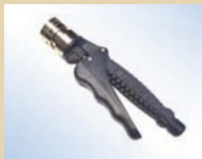
Impugnatura per Quick Inflator, no. art. .... 096074