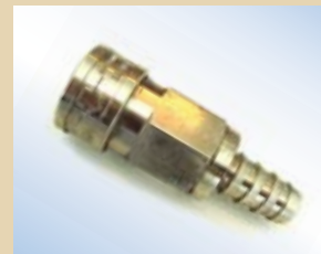
Giunto ad innesto rapido da 1/2" con valvola per Quick Inflator, no. art. .... 096051