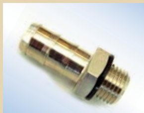
Connettore al tubo dell'impianto per Standard Inflator, no. art. .... 096057