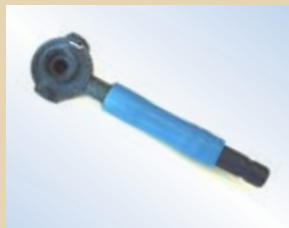
Boccola ad innesto rapido allungata per Quick Inflator, no. art. .... 096079