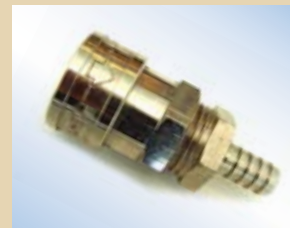
Giunto ad innesto rapido da 3/8" senza valvola per Quick Inflator, no. art. .... 096034