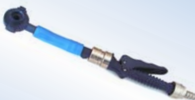
Bates Quick Inflator allungato, no. art. 096077