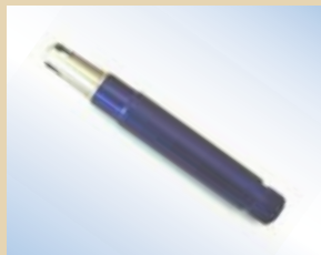
Ugello in alluminio da 80 mm per Standard inflator, no. art. .... 096061