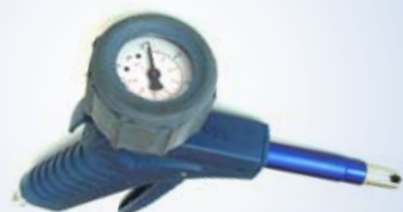
Bates Standard Inflator con manometro Ø40 mm, no. art. 096073