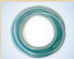
tubo da 1/2" (50 m) no. art. .... 096035 tubo da 3/8" (50 m) no. art. .... 096031