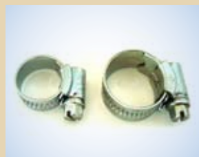
Fascetta 1/2", no. art. .... 096036 Fascetta 3/8", no. art. .... 096033