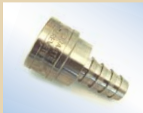
Giunto ad innesto rapido da 1/2" senza valvola per Quick Inflator, no. art. .... 096050