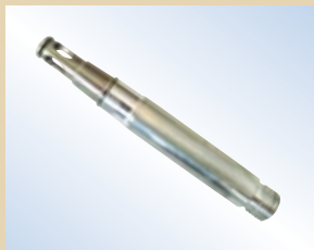
Ugello in alluminio da 80 mm per Flex inflator, no. art. .... 096040