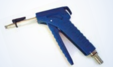
Bates Flex Inflator con ugello da 150 mm e rilascio dell'aria, no. art. 096059