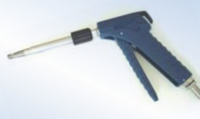
Bates Flex Inflator con manometro Ø63 mm, no. art. 096087