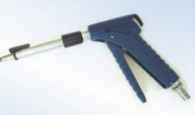
Bates Flex Inflator con click-on, no. art. 096248