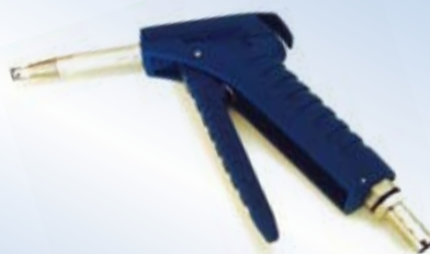
Bates Flex Inflator con ugello da 80 mm, no. art. 096048

Click-on: Bates Flex Inflator può essere fornito con il sistema Click-on. Il suo vantaggio è la possibilità di bloccare l'airbag durante il gonfiaggio senza il pericolo che l'ugello fuoriesca dalla valvola. Questo rende possibile il gonfiaggio usando una sola mano. Alla fine si libera la pistola con una semplice pressione del Click-on.