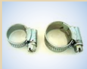
Fascetta 1/2" no. art. .... 096036 Fascetta 3/8" no. art. .... 096033