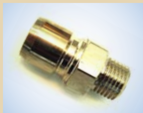
Giunto maschio per Standard/Flex Inflator e Quick Inflator (si adatta velocemente a tutti i modelli di Inflator), no. art. .... 096069