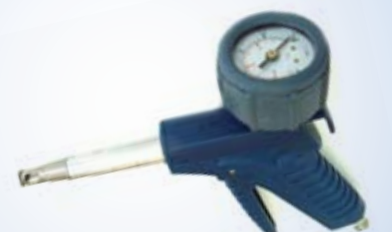
Bates Flex Inflator con manometro Ø40 mm, no. art. 096049