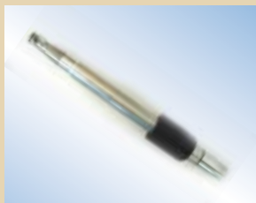
Ugello in alluminio da 150 mm con rilascio dell'aria, no. art. .... 096128