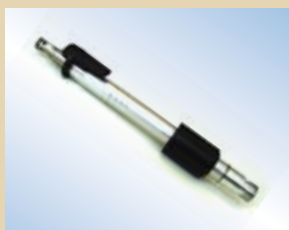
Ugello in alluminio da 150 mm per Flex Inflator con Click-on e rilascio dell'aria, no. art. .... 096228