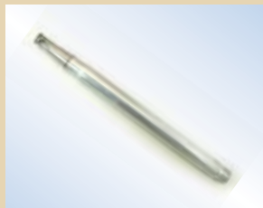
Ugello in alluminio da 150 mm per Flex inflator, no. art. .... 096008