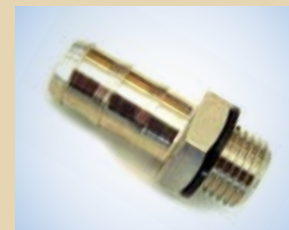
Innesto da 3/8" per Standard Inflator, no. art. .... 096057