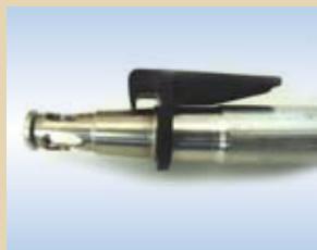
Ugello in alluminio da 80 mm con Click-on, no. art. .... 096240