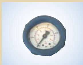
Manometro con rivestimento protettivo in gomma (Ø40 mm – scala 0-2,5 bar), no. art. .... 096053